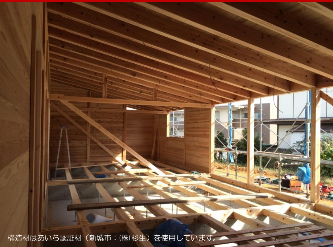
構造材はあいち認証材（新城市：(株)杉生）を使用しています。